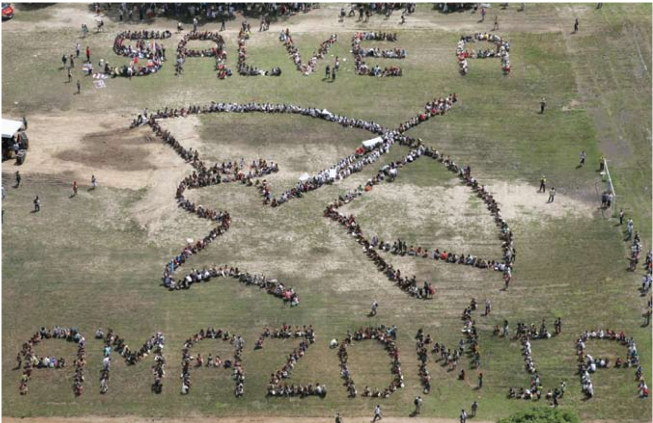
Líderes y lideresas indígenas de las Amazonas, con aliados estratégicos formando una pancarta humana con el mensaje "Salvemos el Amazonas" Belem Do Para, Brazil, 2009.