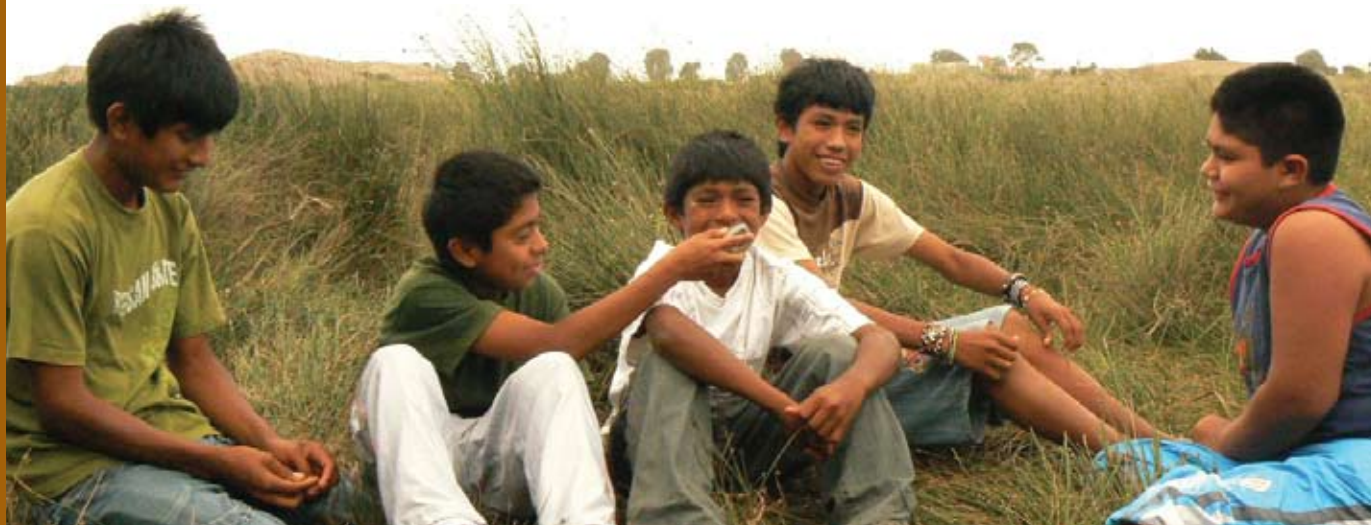
Jóvenes líderes de ACPNI grabando el programa de radio "Somos o no Somos" Lurichincha, Perú, 2009.