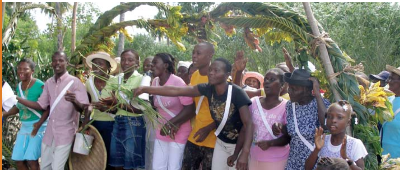
Inauguración de Nuevo Molino de Grano, Fondo de Lambi, Haití.

E l trabajo de AJWS en las Américas abarca a países del Caribe, Mesoamérica y Sudamérica. Los apoyos financieros para la región se centran en los derechos de los pueblos indígenas y afrodescendientes, mujeres y jóvenes, minorías sexuales y personas con VIH y SIDA.