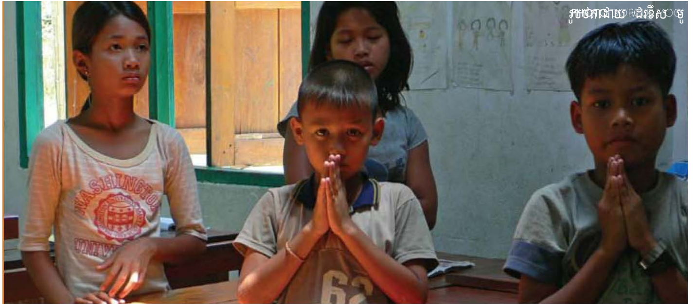
ការអប់រំសំរាប់ទាំងអស់គ្នា សិស្សានុសិស្ស នៅប្រទេស ភូមា

A JWS ធ្វើការនៅប្រទេសចំនួនប្រាំបី នៅទ្វីបអាស៊ី ផ្តល់ជំនួយដល់អង្គការដែលស្វែងរកភាពស្មើគ្នាសំរាប់ប្រជាជនក្រុមតូច អ្នកកាន់សាសនា និងអ្នកនិយមភេទដូចគ្នា ស្ត្រីកសិករខ្នាតតូច អ្នករស់នៅជាមួយ មេរោគអេដស៍ និងជំងឺអេដស៍ ហើយនិងក្រុមដែលគេបោះបង់ចោល។ AJWS បន្តគាំទ្រការស្ថាបនាជាតិឡើងវិញនៅក្នុងដើបឡើងវិញពីការបំផ្លិចបំផ្លាញនៃ ព្យុយក្យូធីស្តូណាមិកនៅឆ្នាំ ២០០៤ ដោយផ្តោតលើការឆ្លើយតបរបស់រដ្ឋាភិបាលទៅនឹងតម្រូវការនៃការមិនផ្តល់សិទ្ធិក្នុងការបញ្ចេញសំលេង និងផ្តោតលើការកសាងឱ្យមានការងើបឡើងវិញរបស់សហគមន៍ក្នុងការត្រៀមខ្លួនរៀបចំសំរាប់ការសង្គ្រោះបន្ទាន់នាពេលអនាគត ។ សន្តិសុខសិទ្ធិកាន់កាប់ដីធ្លី និងការគ្រប់គ្រងទៅលើធនធានធម្មជាតិគឺចំណុចចម្បងចំពោះការផ្តល់ជំនួយ