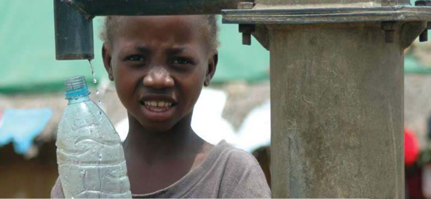
សុវត្ថិភាពសំរាប់ជនភៀសខ្លួន ទីករបស់ក្មេងស្ត្រីប្រាមមកពីជំរុំ IDP នៅទីក្រុង ចាតុនដូ ក្នុងប្រទេស ស៊ីរីយ៉ា

ប្រមាណជា ៦០ភាគរយ នៃយុវវ័យកំពុងរស់នៅជាមួយមេ រោគអេដស៍-ជំងឺអេដស៍នៅ អាហ្វ្រិក គឺជា ស្ត្រី និងក្មេង ស្រី ។ រចនាសម្ព័ន្ធនៃអំណាចមិនស្មើគ្នា និងការរើសអើង ផ្នែកយេឌីវ ធ្វើឱ្យពួកគេកាន់តែមានភាពងាយរងគ្រោះនៃ ការឆ្លង ហើយទទួលបានបន្ទុកចំពោះភាពក្រីក្រ អំពើហិង្សា និង ភាពអយុត្តិធម៌ យ៉ាងធ្ងន់ធ្ងរ ។